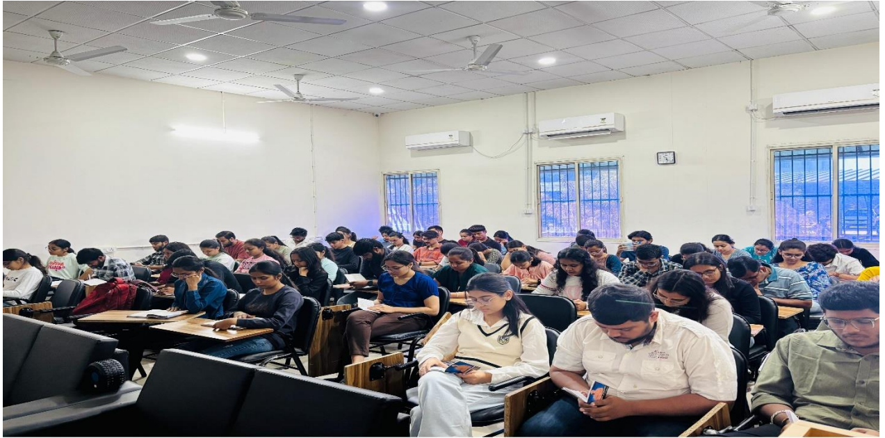
Group reading under "Pushtak Prem Parv" at GTU-SAST Department