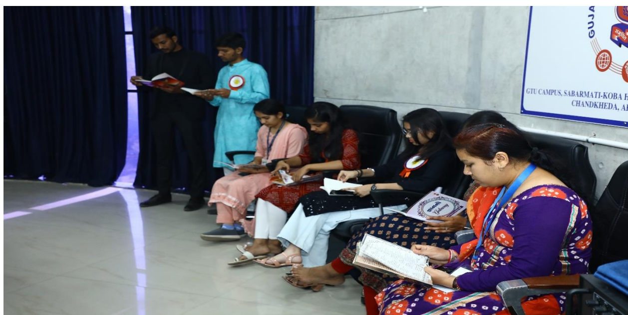
Central Library Staff & Volunteers group reading under "Pushtak Prem Parv"