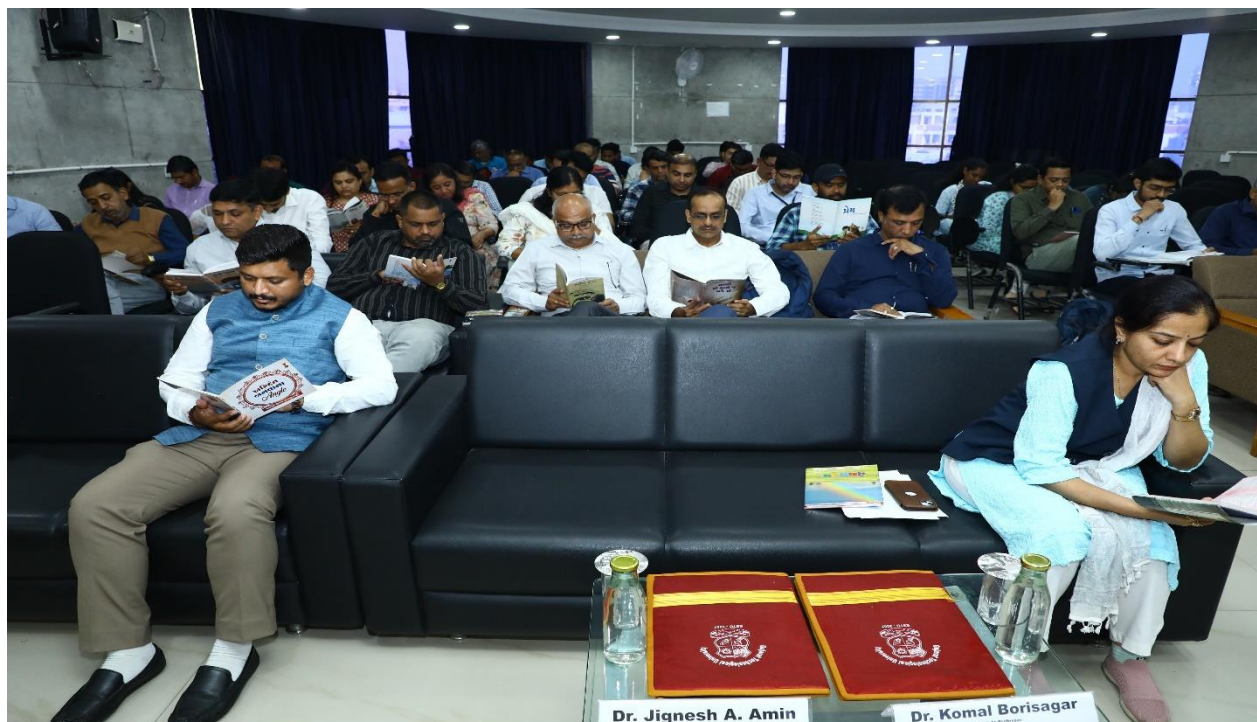
GTU staff members group reading under "Pushtak Prem Parv"