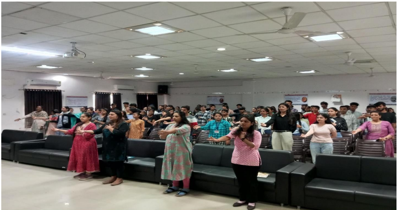
GTU-SMS Department taking oath under "Pushtak Prem Parv"